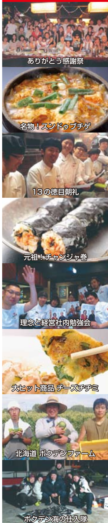
ありがとう感謝祭