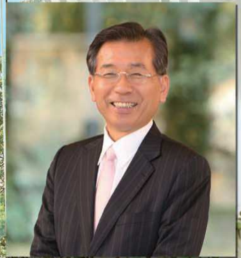
アイ・ケイ・ケイ株式会社 代表取締役社長